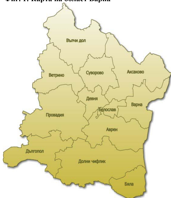
Фиг. 1: Карта на област Варна

Община Вълчи дол се намира в Североизточна България и попада в териториалните граници на област Варна.